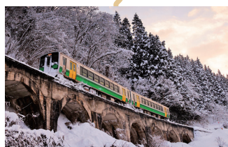
14 細越拱橋(めがね橋) Hosogoe Arch Bridge